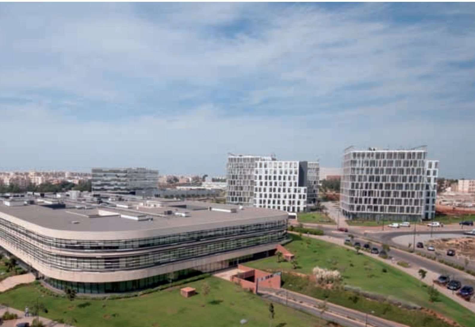
« Vue sur le projet de la Marina de Casablanca »