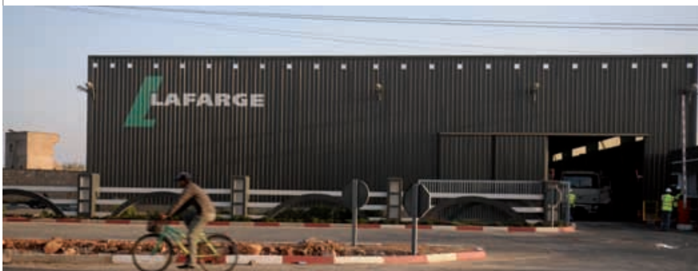
« Centre de distribution de ciment à Khouribga »