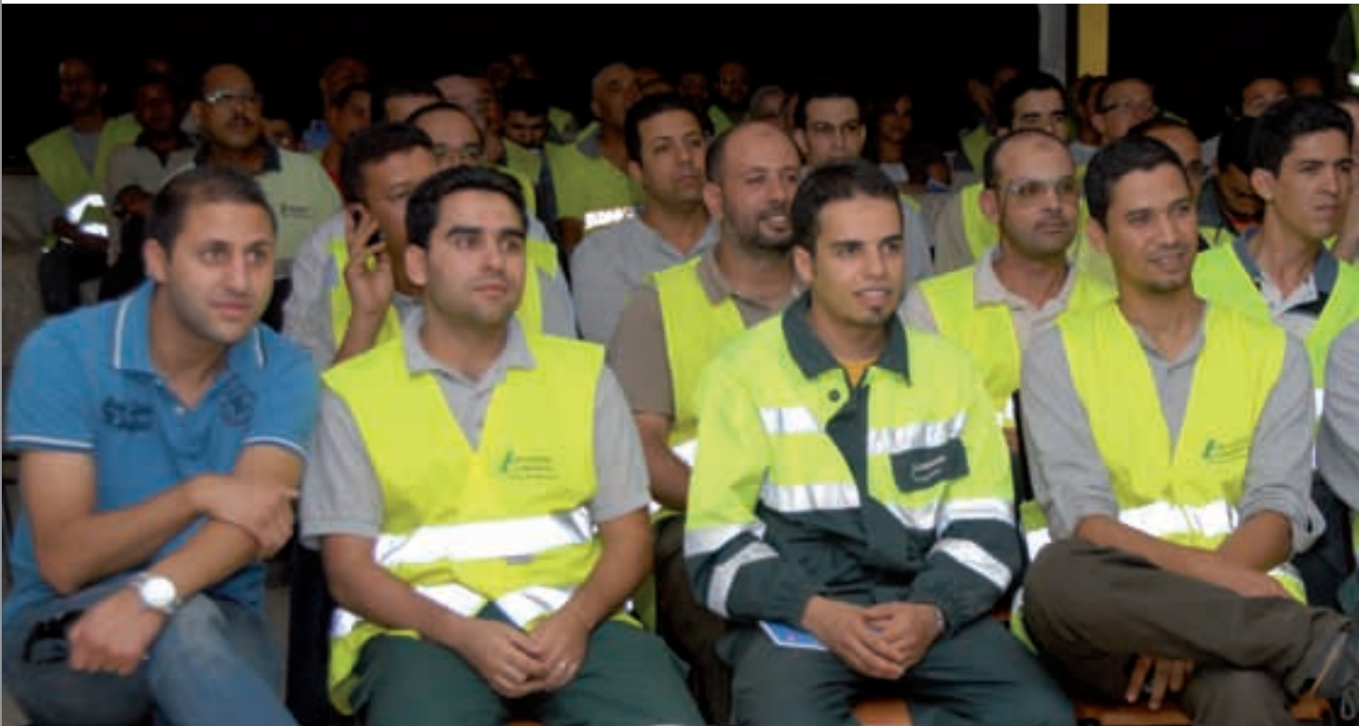
« Collaborateurs de Lafarge Maroc »