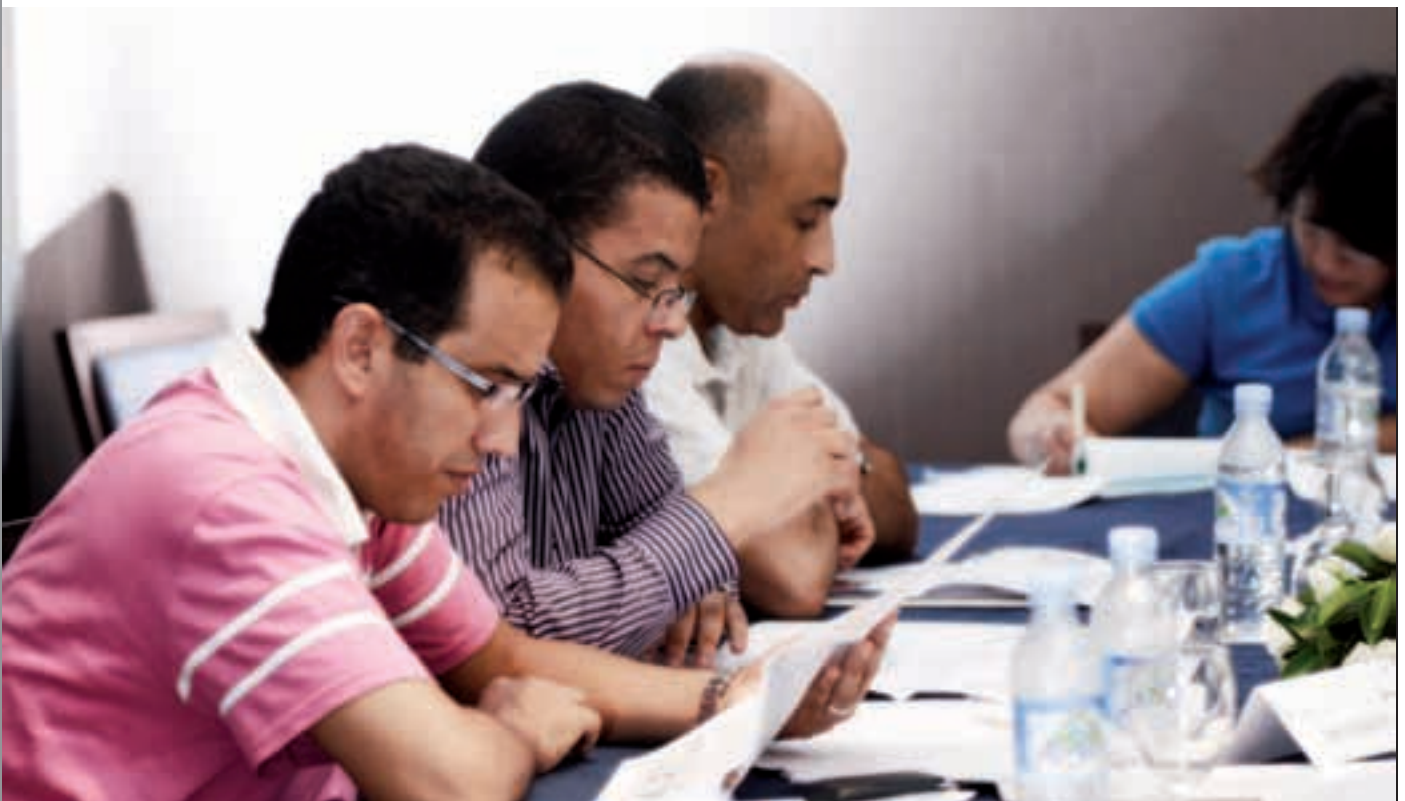
« Collaborateurs de Lafarge Maroc »