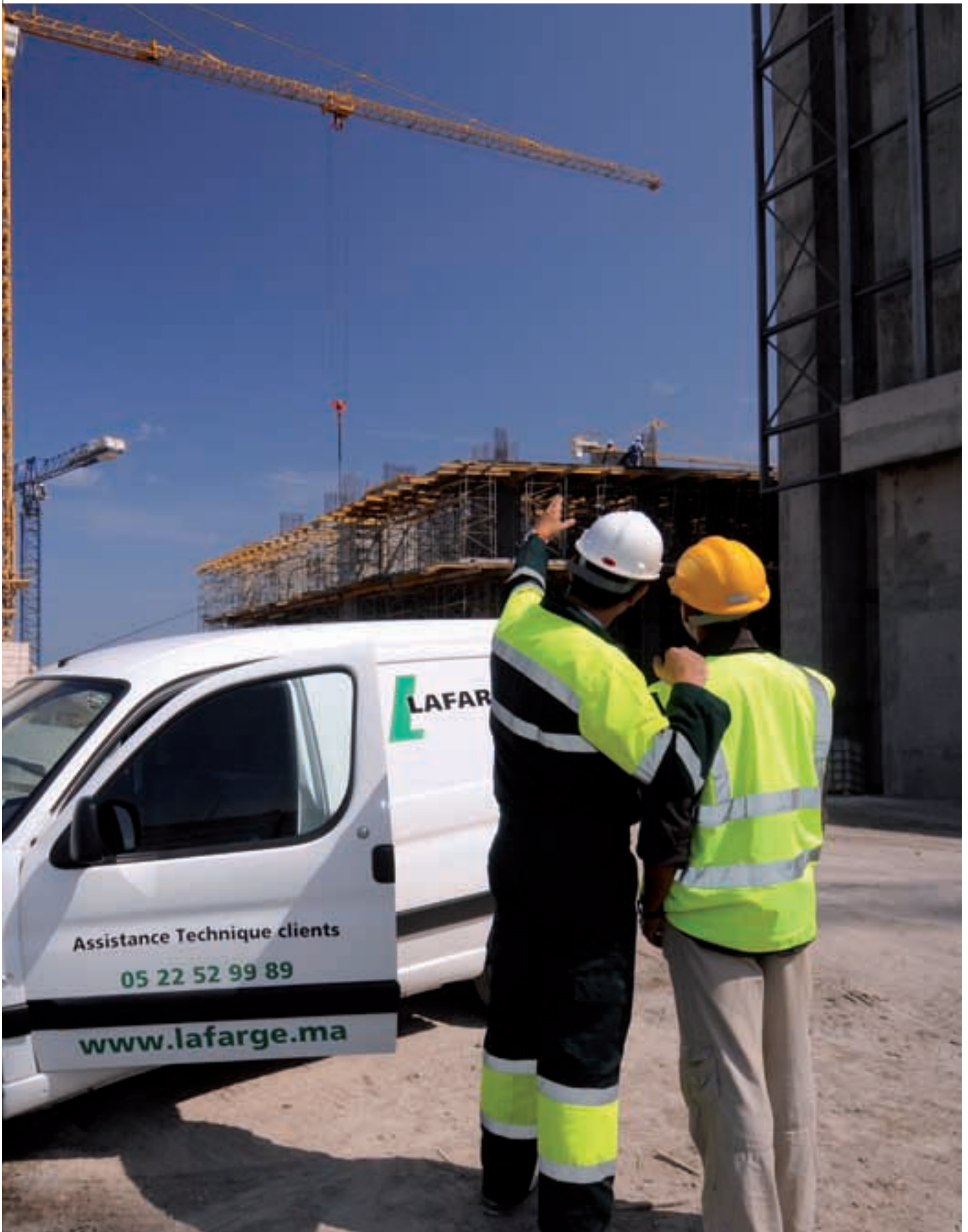
« Assistance technique aux clients »