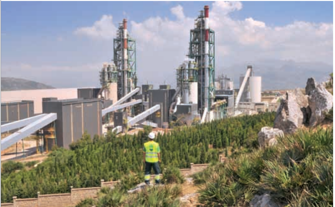
« Vue de l'usine de Tétouan II »